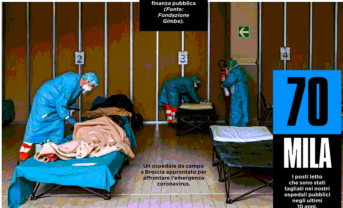
Un ospedale da campo a Brescia approntato per affrontare l'emergenza coronavirus.