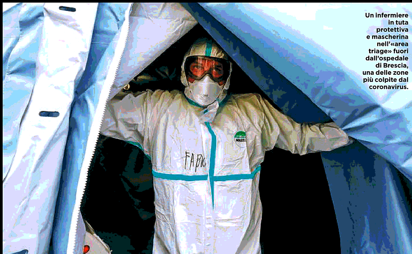
Un infermiere in tuta protettiva e mascherina nell'«area triage» fuori dall'ospedale di Brescia, una delle zone più colpite dal coronavirus.